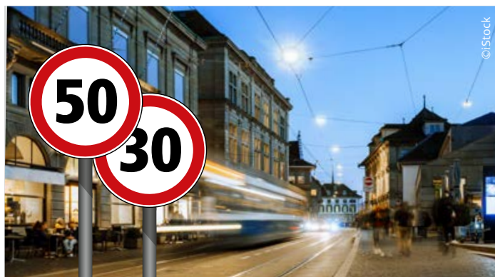
Soll der Kanton der Stadt Tempo 50 aufzwingen dürfen? Die EVP sagt Nein!

Ein Wirrwarr über die Zuständigkeiten zwischen Städten und Kanton bei Strassenbauprojekten wäre vorprogrammiert. Lebensqualität und Sicherheit der städtischen Bevölkerung würden verschlechtert und die Gemeindeautonomie beschnitten. Wenn die Städte für Tempo 30-Strecken zuständig bleiben, der Kanton aber Tempo 50 erzwin-