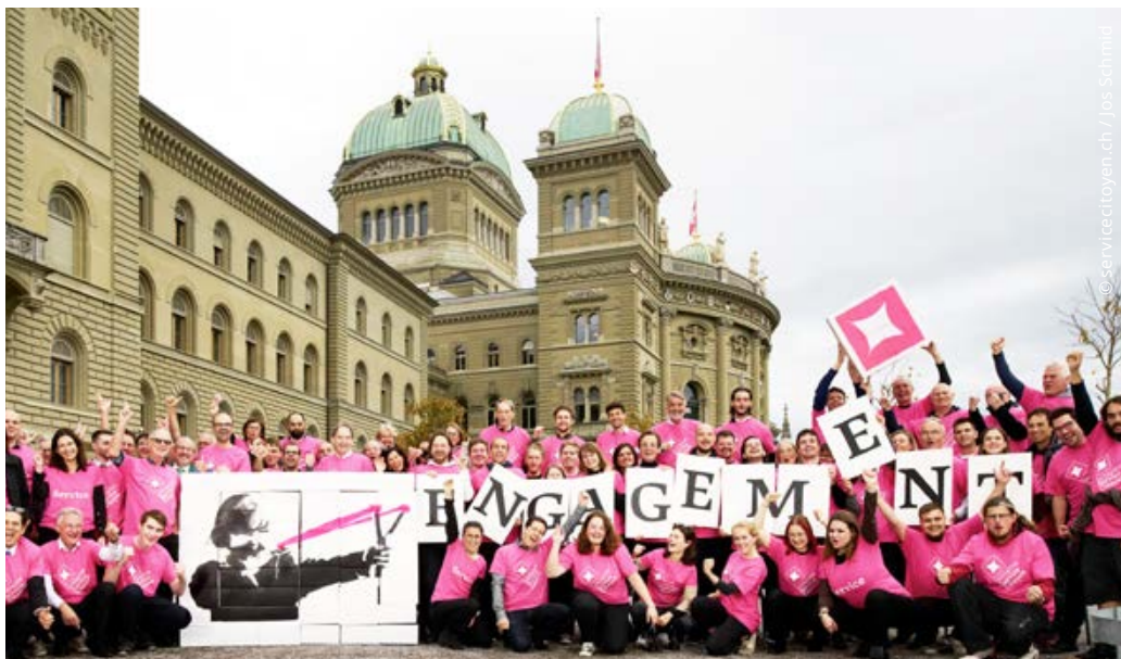
Übergabe der Unterschriften vor dem Bundeshaus