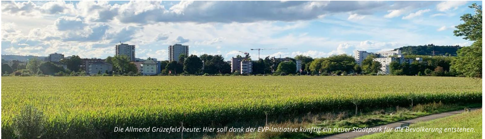
Die Allmend Grüzefeld heute: Hier soll dank der EVP-Initiative künftig ein neuer Stadtpark für die Bevölkerung entstehen.