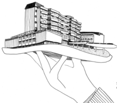
Eine Umnutzung des alten Kispi ist acht Mal günstiger als ein Neubau

Der Name knüpft an eine Gruppe an, die ab 1959 in Zürich aktiv war. Ihr gehörte u.a. der spätere Zürcher EVP-Nationalrat Niklaus Kuhn an. Die Gruppe wehrte sich damals beispielsweise gegen den Abriss der Fleischhalle Zürich