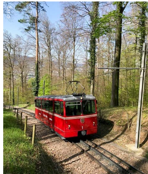
Bald Oldtimer im Verkehrshaus in Luzern – die Dolderbahn auf einer der letzten Fahrten im romantischen Zürichbergwald.

ins Schweizer Verkehrshaus in Luzern in seine Sammlung historischer Fahrzeuge.