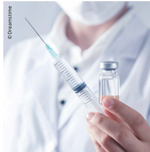
Spritzen – bei Jung und Alt unbeliebt.

die persönliche Freiheit der Bürgerinnen und Bürger unverhältnismässig einzuschränken.