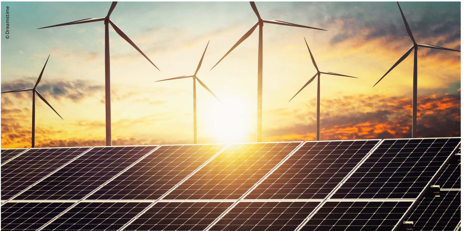
Solarstrom allein kann die Energielücke, vor allem im Winter, nicht schliessen.

Damit bei uns die Lichter nicht ausgehen