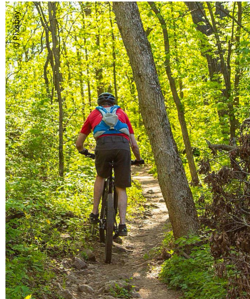
Sport vor der Haustür