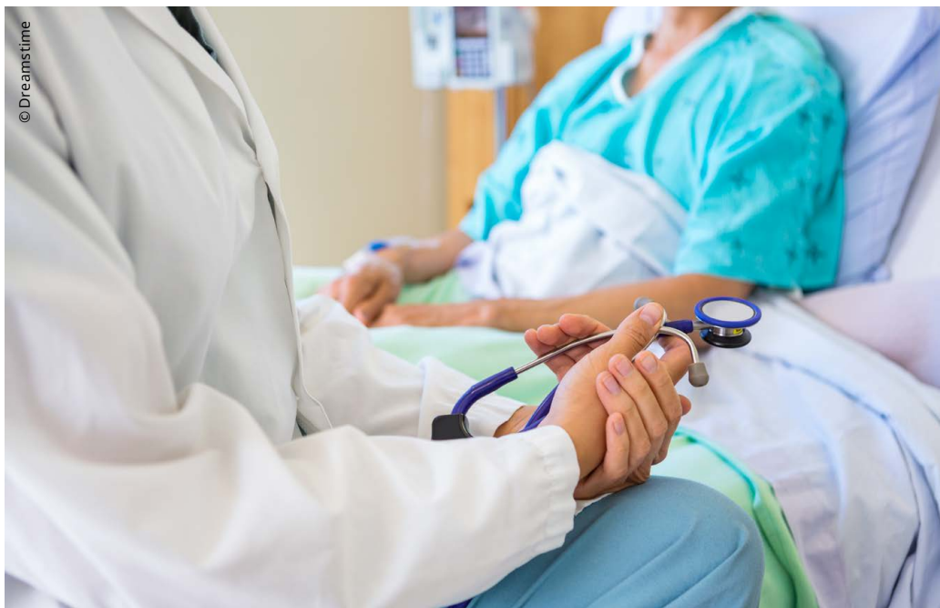
Wo steckt wohl das Sparpotenzial im Gesundheitswesen?

Gesundheitskosten an der Quelle begrenzen